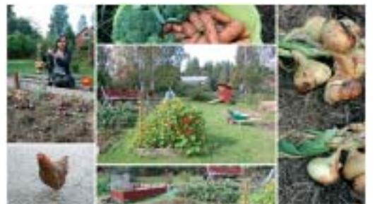
Odlingarna och hönsgården