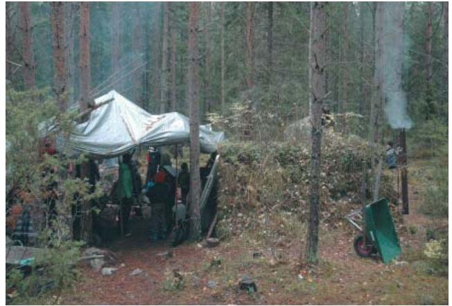
I Skogsbyn finns murika, kaffepannor och ved. Här trivs både äldre och yngre runt lägerelden.