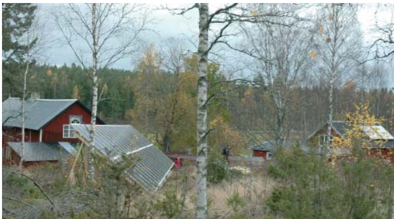
Solceller och solfångare