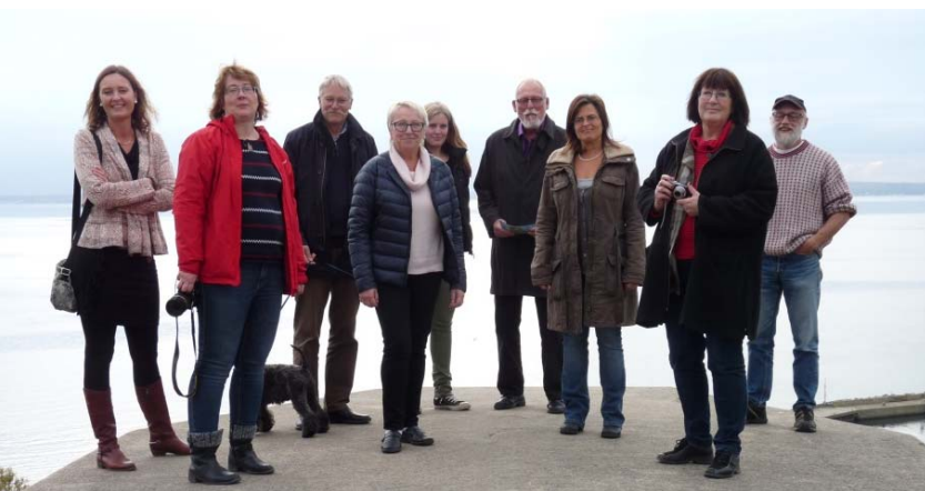
Några av deltagarna vid Kyrkbacken på Ven