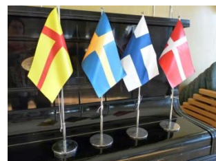
Nordens flagga följd av Sveriges, Finlands och Danmarks flagga.

En slutrapport kommer inom kort att finnas på varje organisations hemsida. Se www.skargardarna.se