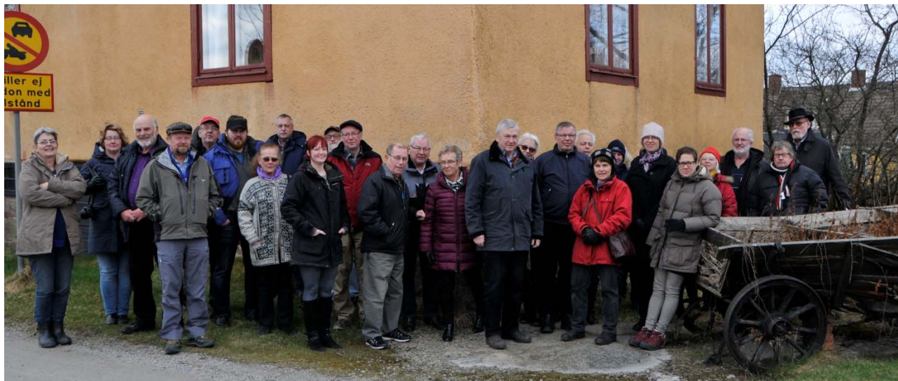
Skärgårdsbor på Årsstämma på Tjurkö i Blekinge.