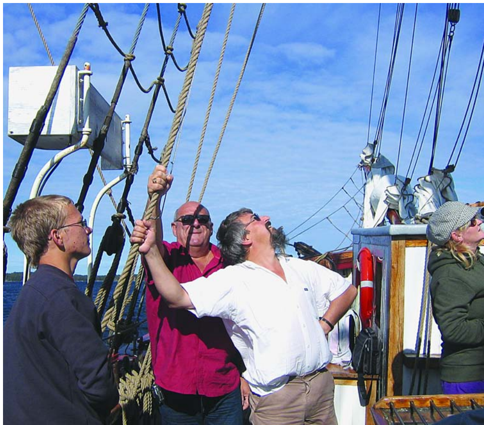
Fransmännen sliter för att sätta segel. Bilden togs i samband med ESIN:s femårsjubileum på Idö i Västerviks skärgård.

Möjligheter och problem är i stort lika, oavsett om du lever i Sverige eller någon annanstans i Europa, så länge du bor på en ö.