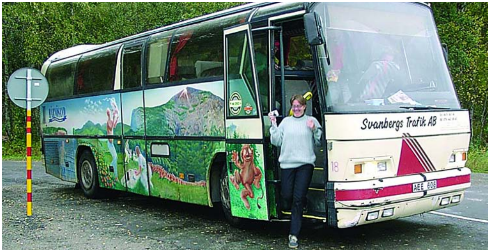
Pia stiger just av hemsöbussen med kameran i skjutläge.

Det kändes litet märkligt att sitta så långt under jorden och inta en delikat middag, men trevligt var det.