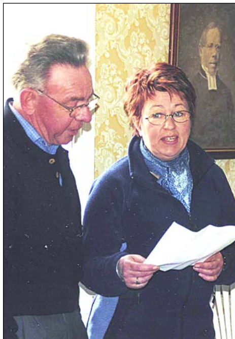
Visförfattarna framför sitt opus. I bakgrunden syns anfadern till SVTRF, Sveriges Vistextförfattares Riksförbund.

Det uppdrogs då till övriga föreningar att till nästa möte ha skrivit en visa. Men till dags dato (augusti 2007) har ännu ingen sådan presenterats.