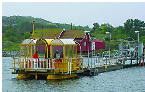
Linfärjan mellan Nord- och Sydkoster.