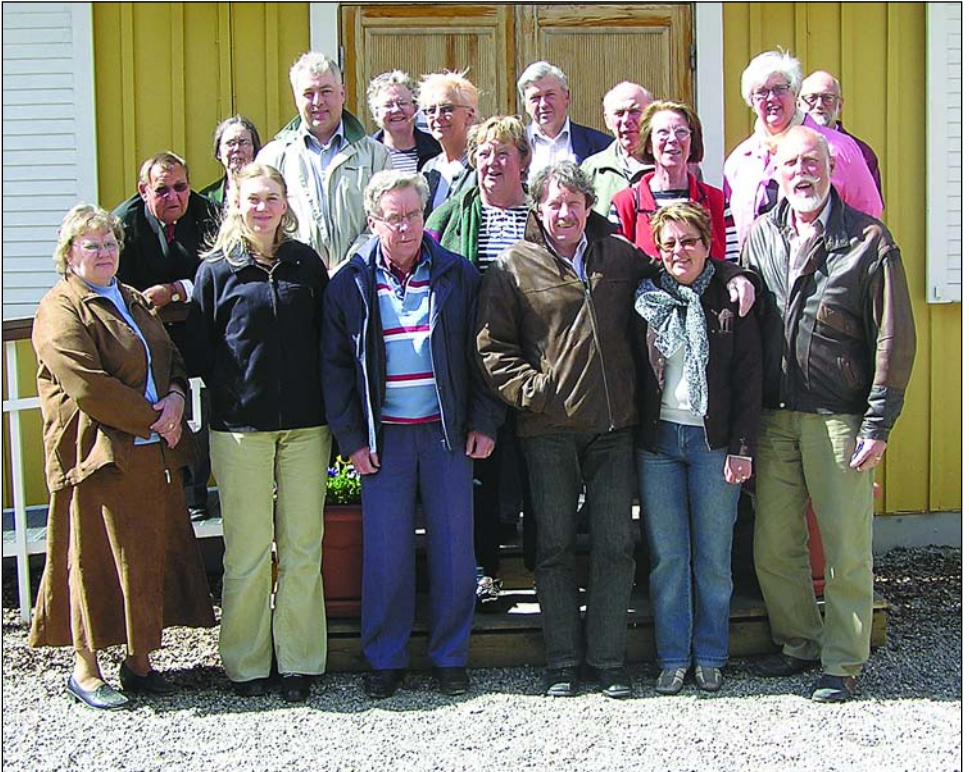
De närvarande ur SRF:s styrelse samlades i solskenet för ett gruppfoto.

Söderhamns kommun bjöd på en god middag som intogs på "Kvarnen" ett gammalt kvarnhus, som tydligen endast används för konferensmåltider.