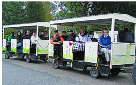
Kostertåget. Notera DagLundmans säkerhetsanordning.

Koster bjöd på sällsynt dåligt väder, det regnade hela tiden. Men en utflykt blev det. Med Kostertåget ner till den lilla linfärjan - som kommit till tack vare bidrag från EU - för överfart till Nordkoster. Information om det planerade byggandet av ett all-hus där mycket social service skulle inrymmas. Permanentbostäder, även handikappanpassade, kultursal och t o m frisör.