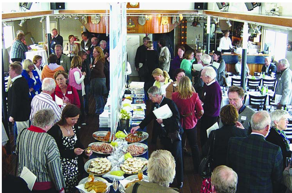
Mötet på Teaterskeppet inleddes med en stunds minglande, där gästerna bjöds på olika kulinariska läckerheter från öar. Och så diverse broschyrmaterial.