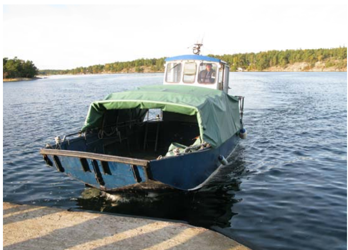
Fåren flyttas i denna Skerfe-färja med fällbar ramp.

Djuren betar dels på hemön, men också på flera andra öar i närheten. Slakt sker på Ö-slakt, det lilla slakteriet i Tavastboda på Värmdö, som man kan nå både via båt och bil.