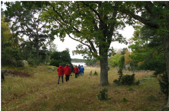
Rundvandring på betesholmen Rågskär.

Efter omfattande restaureringar av marken och med nöt och får som betar här varje sommar, så har man nu lyckats återskapa ön såsom den sett ut längre tillbaka i tiden. Kombinationen bete, ängsslåtter, röjning, hamling och fagning gör nu Rågskär till en artrik och öppen skärgårdsö med stort kulturvärde. Ön ägs idag av staten och förvaltas av Naturvårdsverket, som i sin tur upphandlar underförvaltare.