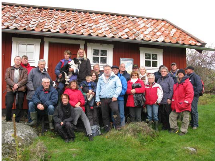
Deltagarna samlade vid stugan på Rågskär

2005 gjorde SRF den första inventering som skett av djurhållare med gårdscentrum på öar utan fast landförbindelse. Inventeringen ska under 2010 uppdateras och även kompletteras med fler uppgifter om företagen. Syftet med inventeringen är att stärka och utveckla nätverket för skärgårdsbönder. Men det är också viktigt att förse myndigheterna med en bra beskrivning av skärgårdsböndernas situation för att lättare kunna få förståelse för förbättrade villkor. Det är mycket få, men viktiga lantbrukare, som gör en stor nytta för landskapsvården i skärgårdarna.