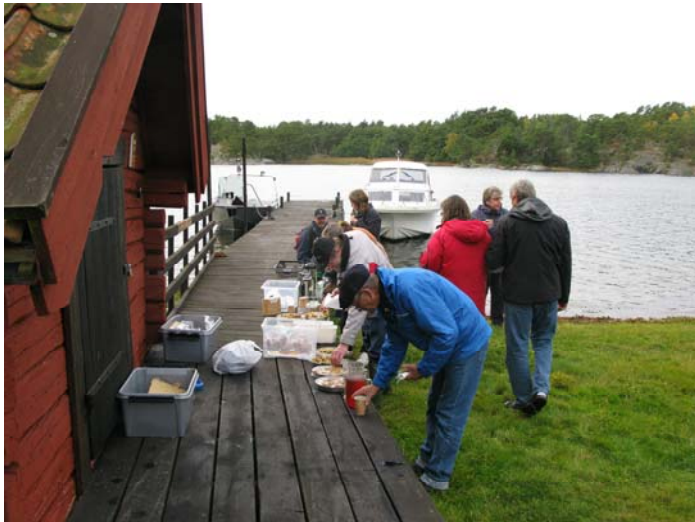
Fikapaus på bryggan och en stund att prata med varandra

Man går nu vidare i en del två, som ska utformas utifrån brukarnas önskemål och kan till exempel handla om kompetensutveckling och rådgivning. Detta ska ske under 2010.