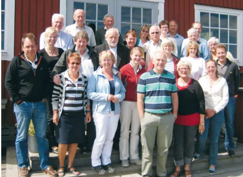
På ön Fejan i Roslagen möttes skärgårdsbor från olika delar av Sverige och representanter för olika myndigheter för att samtala kring aktuella skärgårdsfrågor.

Ett flertal myndigheter deltog och nedan ges lite kort information om vilka aktuella skärgårdsfrågor de hål-