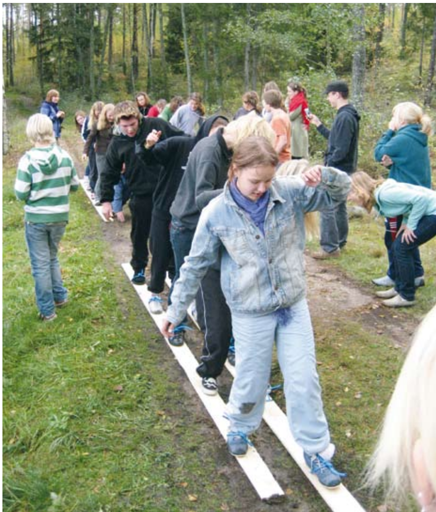
Samarbetsövning från BUS-träff i Nagu hösten 2006.

Kommunerna måste sätta ner foten och bestämma sig. Planprocesser kan tas fram genom att en konsult gör jobbet. SIKO ska tvinga fram ett ställningstagande, ett ja eller nej. Inte ett "jasså".