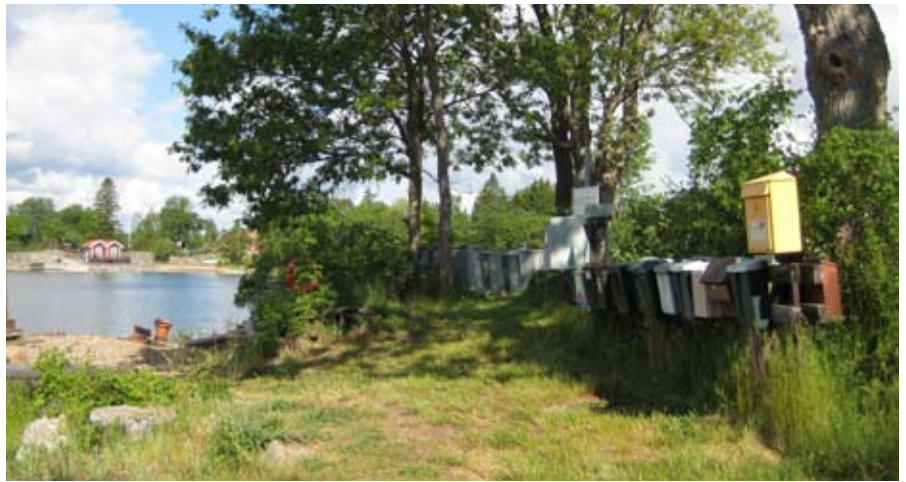
Ett viktigt brev behövde skickas under Skärgårdsforum. Efter mycket letande på ön hittade vi till sist den åtråvärda gula lådan bredvid en rad med postlådor.

I Sverige finns 1700 kronoholmar, främst i Norrbotten och på västkusten. En redovisning gavs om hur