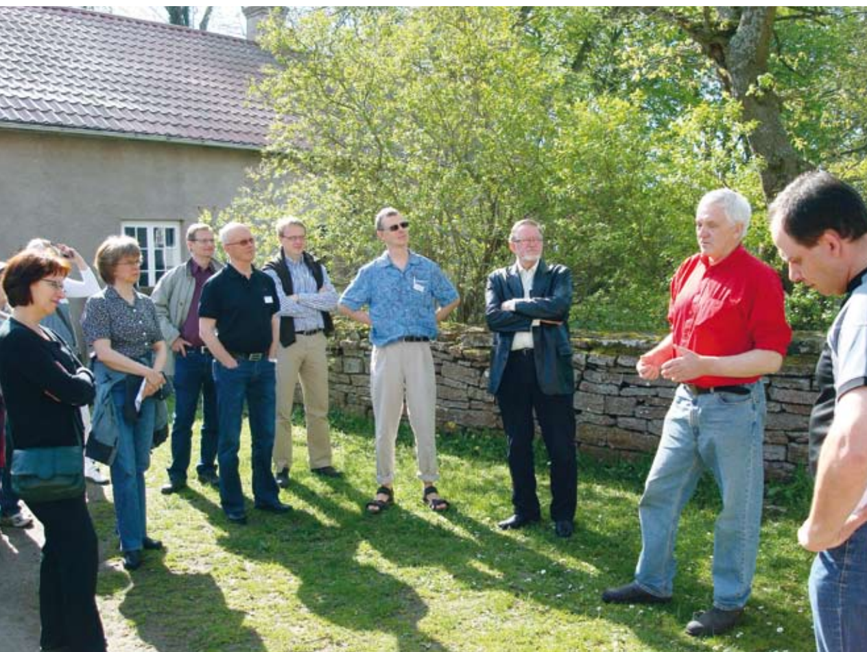
Bonden med det "lilla" gurklandet på 8 hektar.

Vid de två sammanträden som hittills hållits har också ledamöter från Europeiska kommissionen deltagit. De ställer frågor och kommer också med upplysningar.