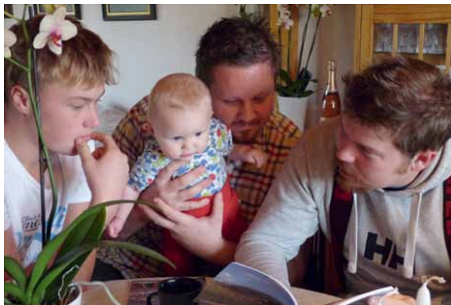
Grabbarna i SURF studerar en skrift från SRF om livet på öar i Europa.