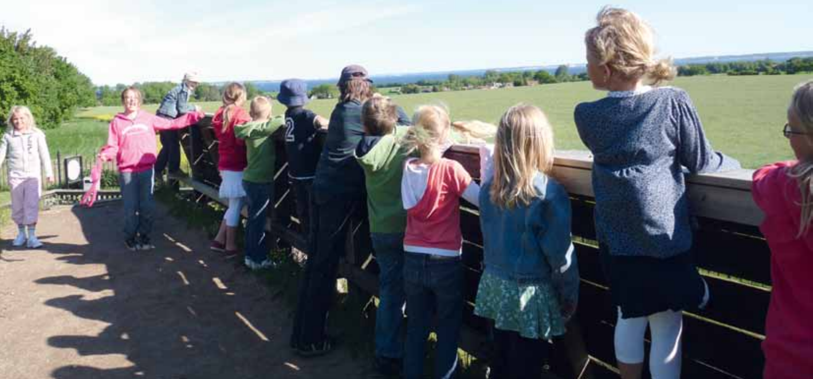
Skolbarnen på Uranienborgs skola kan se både Sverige och Danmark från sin skolgård mitt på ön.

Under hösten har det hörts oro från såväl personal som föräldrar från olika håll i skärgården. Den nya skollagen, vad innebär den egentligen? Oron sprider sig. Hur ska det gå? Man pratar om att flytta de äldre eleverna till större skolor på fastlandet. På vissa håll är hela skolor i farozonen. Var finns helhetsperspektivet för skärgårdssamhällena? Hur långa resor och arbetsdagar kan man räkna med att skolbarn ska behöva ha?